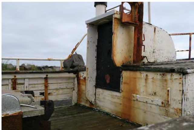
Bragi GK 274, lúkrskappi og bakki.

Áhugaverður bátur, smíðaður hjá Bátalóni, gerður út frá ýmsum höfnum. Vegna lítils viðhalds undanfarin ár fúnar hann hratt.