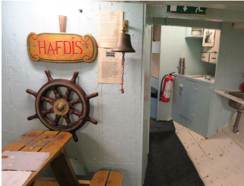
Messi Hólmsteins.. Spjaldið „Hafdís“ var framan á stýrishúsinu fyrstu árin.