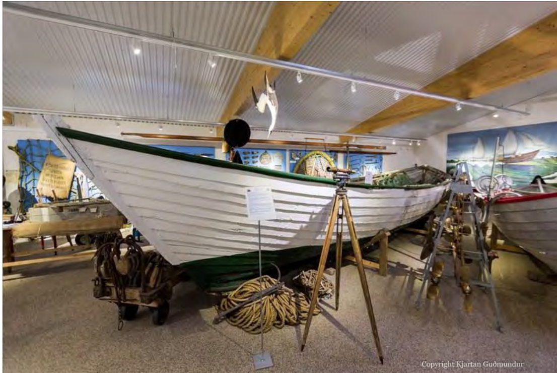
Hreggviður GK 434 þegar hann var á sýningunni á Byggðasafninu í Garði.