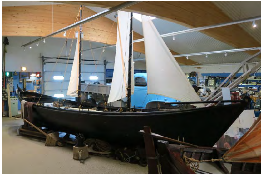
Árabáturinn Fram séð að framanverðu, 2017.