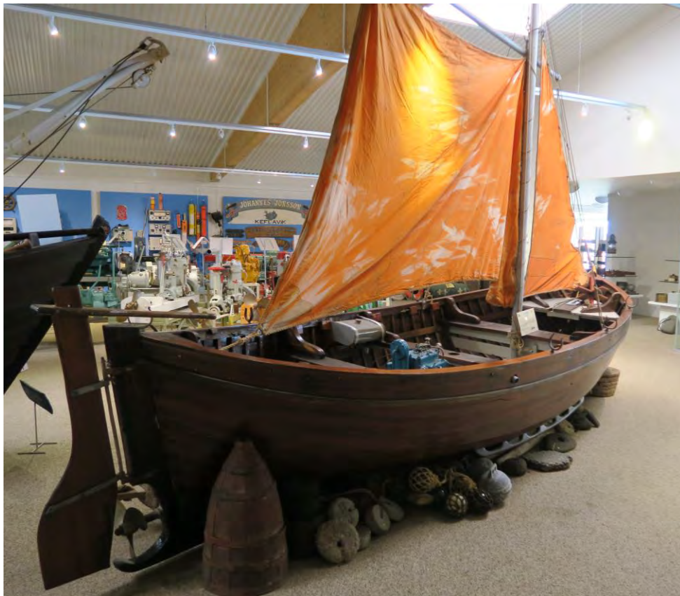
Björgunarbáturinn á sýningu Byggðasafnsins á Garðskaga, 2017.

Þetta er vandaður bátur og vel við haldið (harðviðartrilla)