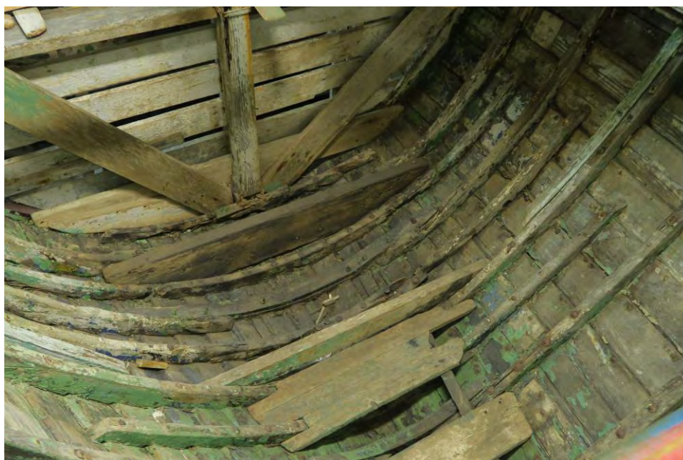
Botn Hreggviðs, 2017. Báturinn ber það með sér að hafa staðið úti einhvern tíma.