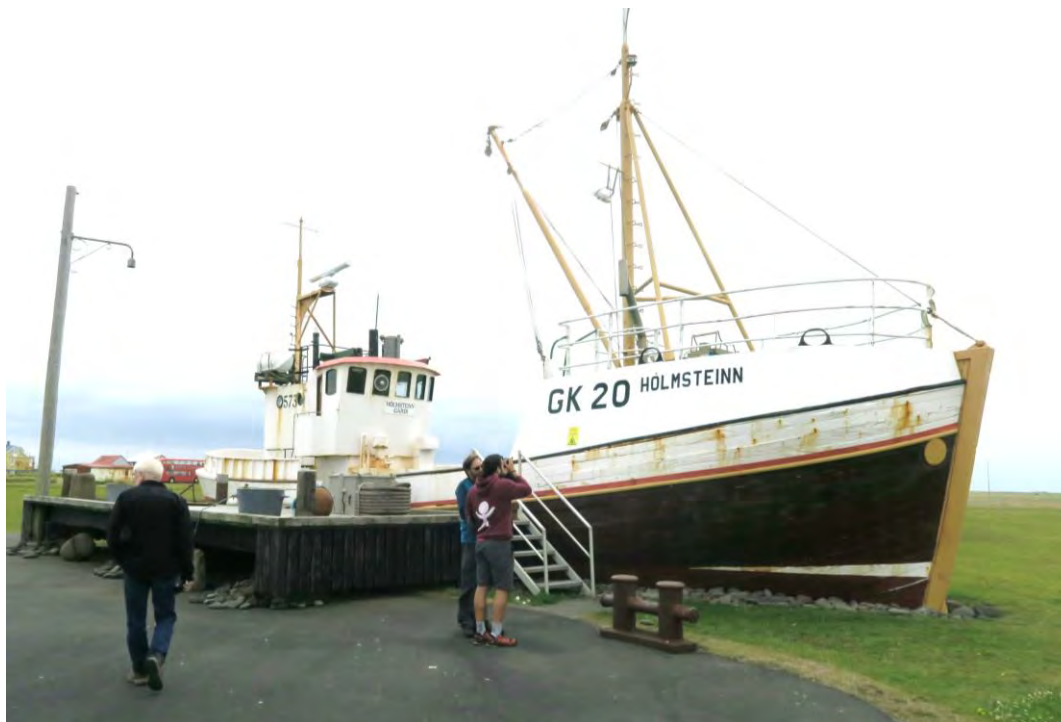
Hólmsteinn GK 20 á safnsvæði byggðasafnsins. Hann er við bryggju úr aldar gömlum viðum sem fengust í Viðey, Reykjavík, þegar bryggja þar var rifin.