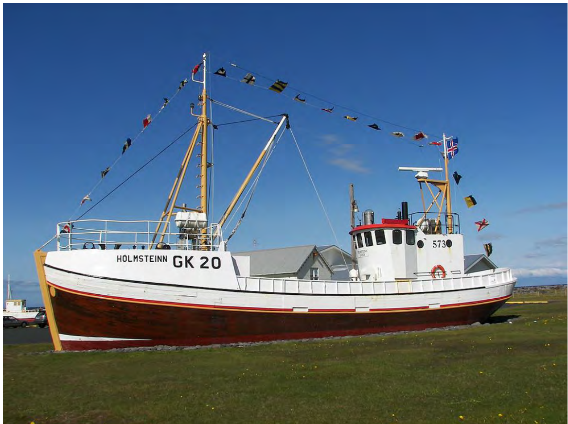
Hólmsteinn GK 20 á útisvæði Byggðasafnsins. Ljós. KristnyB