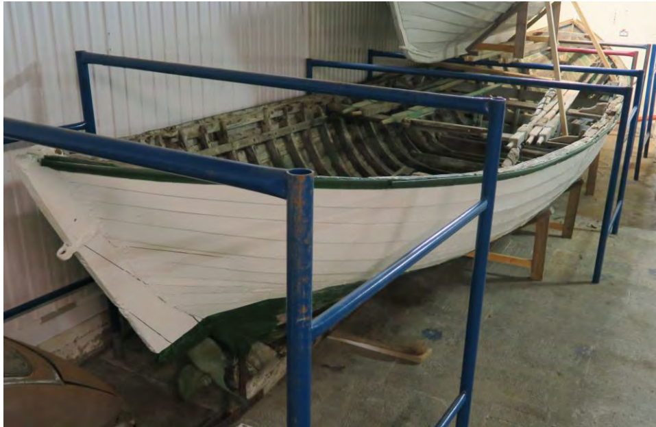
Hreggviður í geymslu 24.8. 2017.