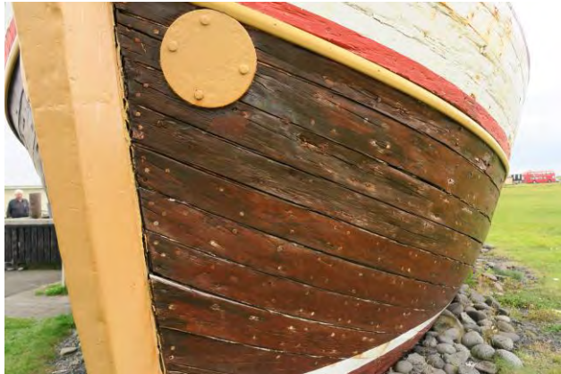
Stefni Hólsteins. Ljós. HMS