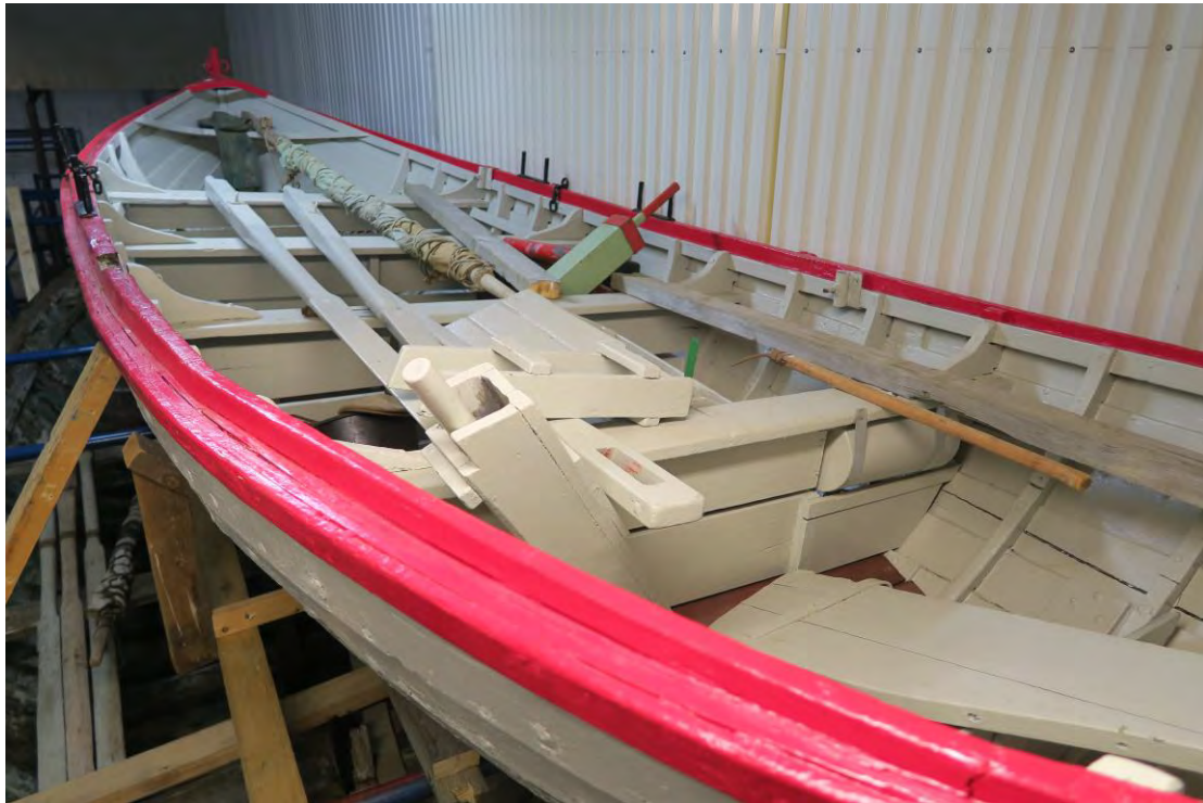
Þorsteinn GK 327 í geymslu, 2017.