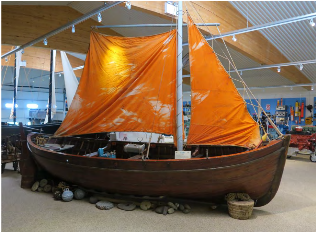
Björgunarbáturinn á sýningu Byggðasafnsins á Garðskaga, 2017.