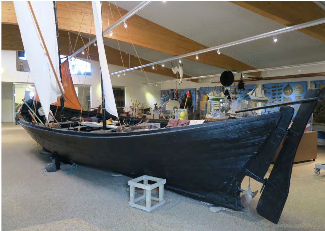
Árabáturinn og síðar vélbáturinn Fram á sýningu Byggðasafnsins, 2017.