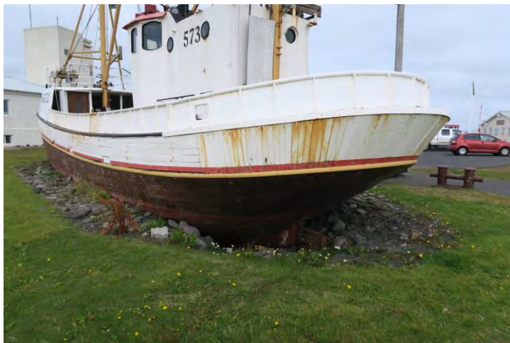
Skutur Hólsteins.. Ljós. HMS