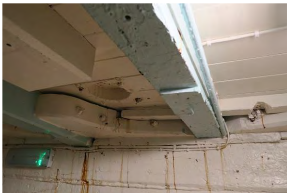
Loftið í messanum á Hólmsteini.