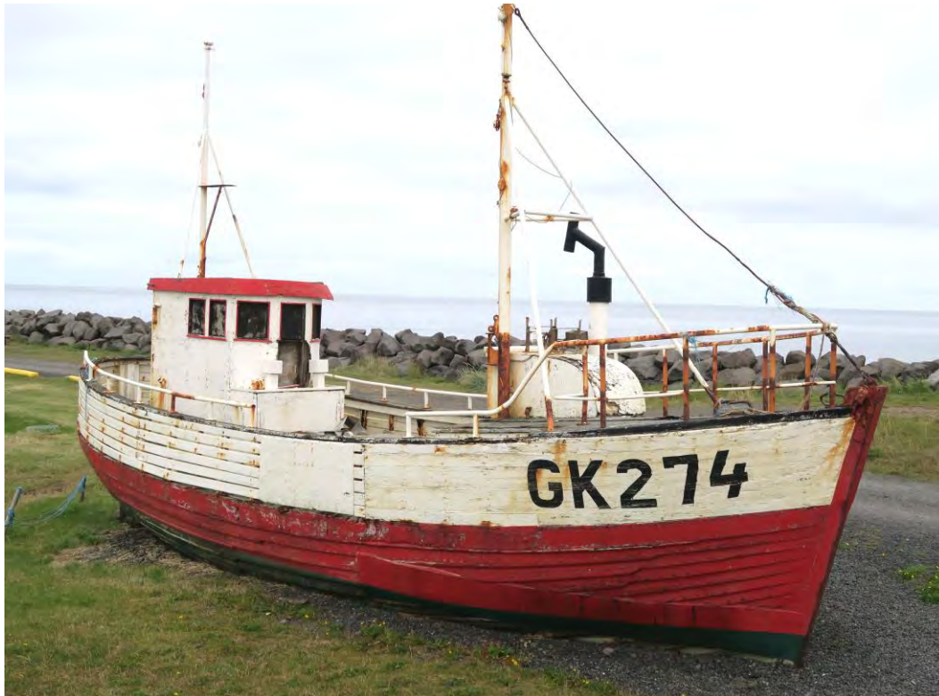
Bragi GK 274 á lóð Byggðasafnsins á Garðskaga, 24.8. 2017.