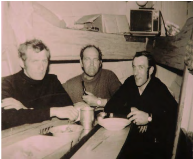
Skipverjar um borð í Hólmsteini.