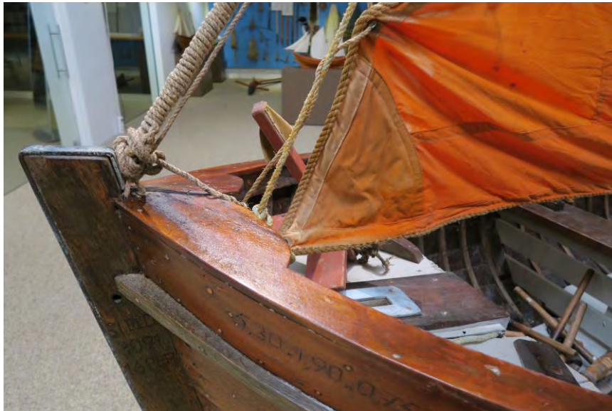
Mahoní og eir einkenna björgunarbátinn. Seglið er ófúíð.