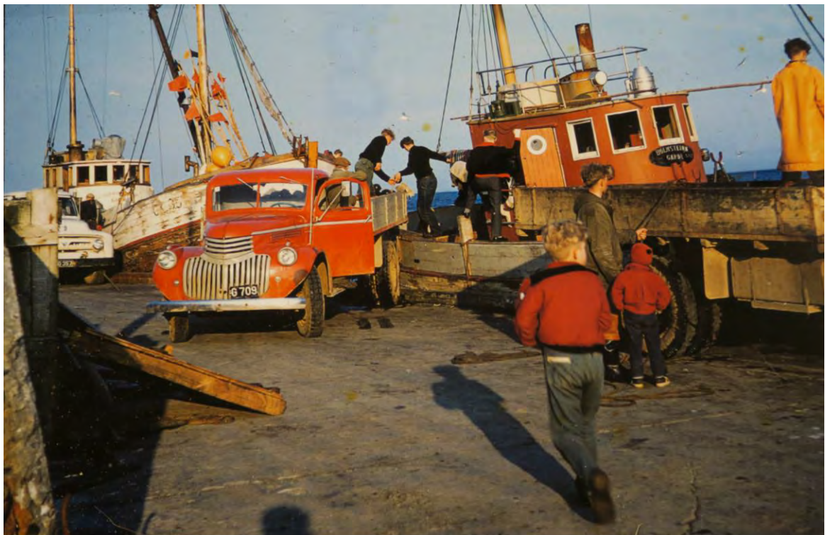
Á bryggjustubbum við Lambastaðavör árið 1960. Hólmsteinn er hægra megin.