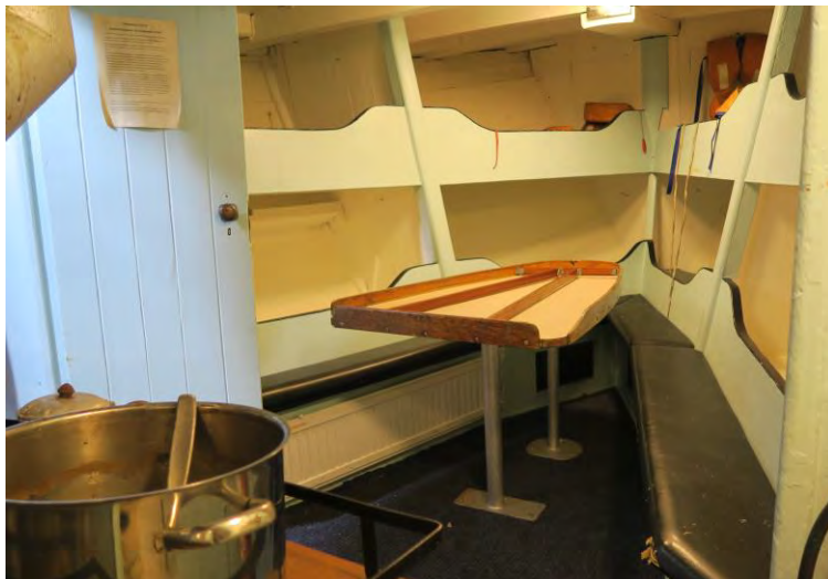
Lúkar Hólmsteins, 2017. Ljós. HMS