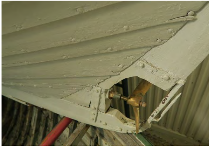
Skuturinn og skrúfan á Þorsteini GK.