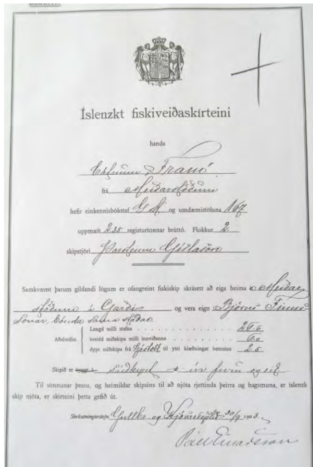
Fiskveiðiskírteini fyrir Fram frá árinu 1903.