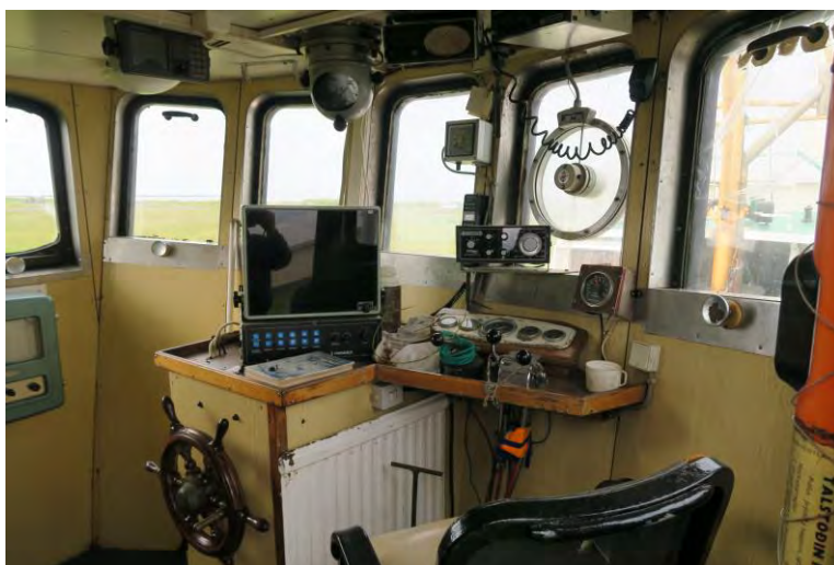
Stýrishús Hólsteins..