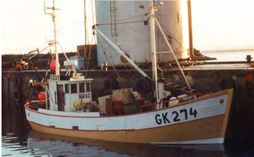
Bragi GK 274, í Njarðvíkurhöfn.